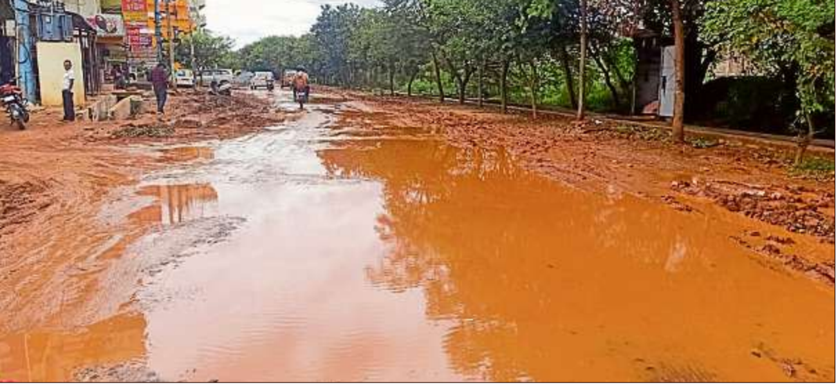
ಮಳೆಯಿಂದಾಗಿ ಕೆಸರು ಗದ್ದೆಯಾಗಿರುವ ಕಿತ್ತಗಾನಹಳ್ಳಿ ರಸ್ತೆ

ಪ್ರಜಾವಾಣಿ ವಾರ್ತೆ ಅನೇಕಲ್: ಮಳೆ ಬಂದರೆ ಸಂಪೂರ್ಣ ಕೆಸರು ಗದ್ದೆಯಾಗುವ ತಾಲ್ಲೂಕಿನ ಕಿತ್ತಗಾನಹಳ್ಳಿ ರಸ್ತೆಯಲ್ಲಿ ಜನರು ಹಾಗೂ ವಾಹನ ಸವಾರರು ಸಂಚಾರ ಮಾಡಲು ಹರಸಾಹಸ ಪಡುವ ಪರಿಸ್ಥಿತಿ ನಿರ್ಮಾಣವಾಗಿದೆ. ರಾಷ್ಟ್ರೀಯ ಹೆದ್ದಾರಿ 7ರಲ್ಲಿ ನಾರಾಯಣ ಹೃದಯಾಲಯಕ್ಕೆ ಹೊಂದಿಕೊಂಡಂತಿರುವ ಕಿತ್ತಗಾನಹಳ್ಳಿ ರಸ್ತೆಯು ಹೆನ್ನಾಗರ, ಮಾಸ್ತೇನಹಳ್ಳಿ, ಎಚ್.ಹೊಸಹಳ್ಳಿ, ರಾಜಾಪುರ, ಶ್ರೀರಾಂಪುರ ಸೇರಿ ಹಲವು ಗ್ರಾಮಗಳಿಗೆ ಸಂಪರ್ಕ ಕಲ್ಪಿಸುವ ರಸ್ತೆಯಾಗಿದೆ. ಹಲವು ಶಾಲೆಗಳು, ಪ್ರೌಢಶಾಲೆ, ಧಾರ್ಮಿಕ ಕ್ಷೇತ್ರವಾದ ಮಾಸ್ತೇನಹಳ್ಳಿ ವೀರಭದ್ರಸ್ವಾಮಿ ದೇವಾಲಯ, ರಾಜಾಪುರ ಸಂಸ್ಥಾನ ಮಠ, ಹೆನ್ನಾಗರ ಯಲ್ಲಮ್ಮದೇವಿ ದೇವಾಲಯಗಳು ಹಾಗೂ ಜಿ.ಪಿ. ಕೈಗಾರಿಕೆ ಪ್ರದೇಶಕ್ಕೆ ಸಂಪರ್ಕ ಕಲ್ಪಿಸುವ ರಸ್ತೆ ಇದಾಗಿದೆ. ನಿತ್ಯ ಸಾವಿರಾರು ಮಂದಿ ಸಂಚರಿಸುವ ಈ ರಸ್ತೆ ಅಭಿವೃದ್ಧಿ ಕಾಣದೇ ಜನರು ಪರದಾಡುವಂತಾಗಿದೆ. ಏತ ನೀಲಾವರಿ ಯೋಜನೆಯಡಿ ಕೆರೆ ಗಳನ್ನು ತುಂಬಿಸಲು ಪೈಪ್‌ಲೈನ್ ಕಾಮಗಾರಿ ಪ್ರಾರಂಭಿಸಿದ್ದರಿಂದ ರಸ್ತೆ ಹದಗೆಟ್ಟಿದೆ. ಕಾಮಗಾರಿಗೆ ಎಚ್.ಹೊಸಹಳ್ಳಿ ಬಳಿ ತಡೆಯಾತ್ಮಕ ತಂದಿದ್ದರಿಂದ ಕಾಮಗಾರಿ ಸ್ಥಗಿತಗೊಂಡಿತ್ತು.